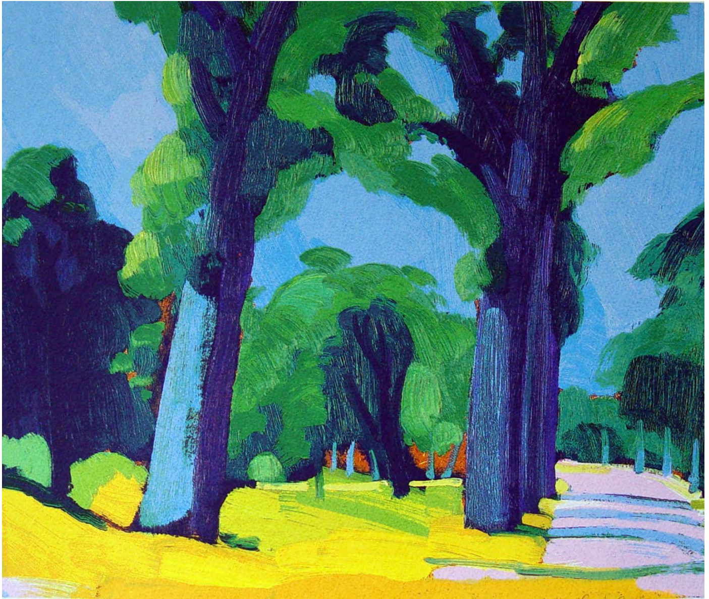
Jentsje Popma (Zwolle, 30 september 1921 – Leeuwarden, 28 september 2022) Zomer

chabotgroep@xs4all.nl . Prikbord is voor elk lid bedoeld en ieder kan zijn of haar bijdrage leveren. Suggesties zijn welkom.